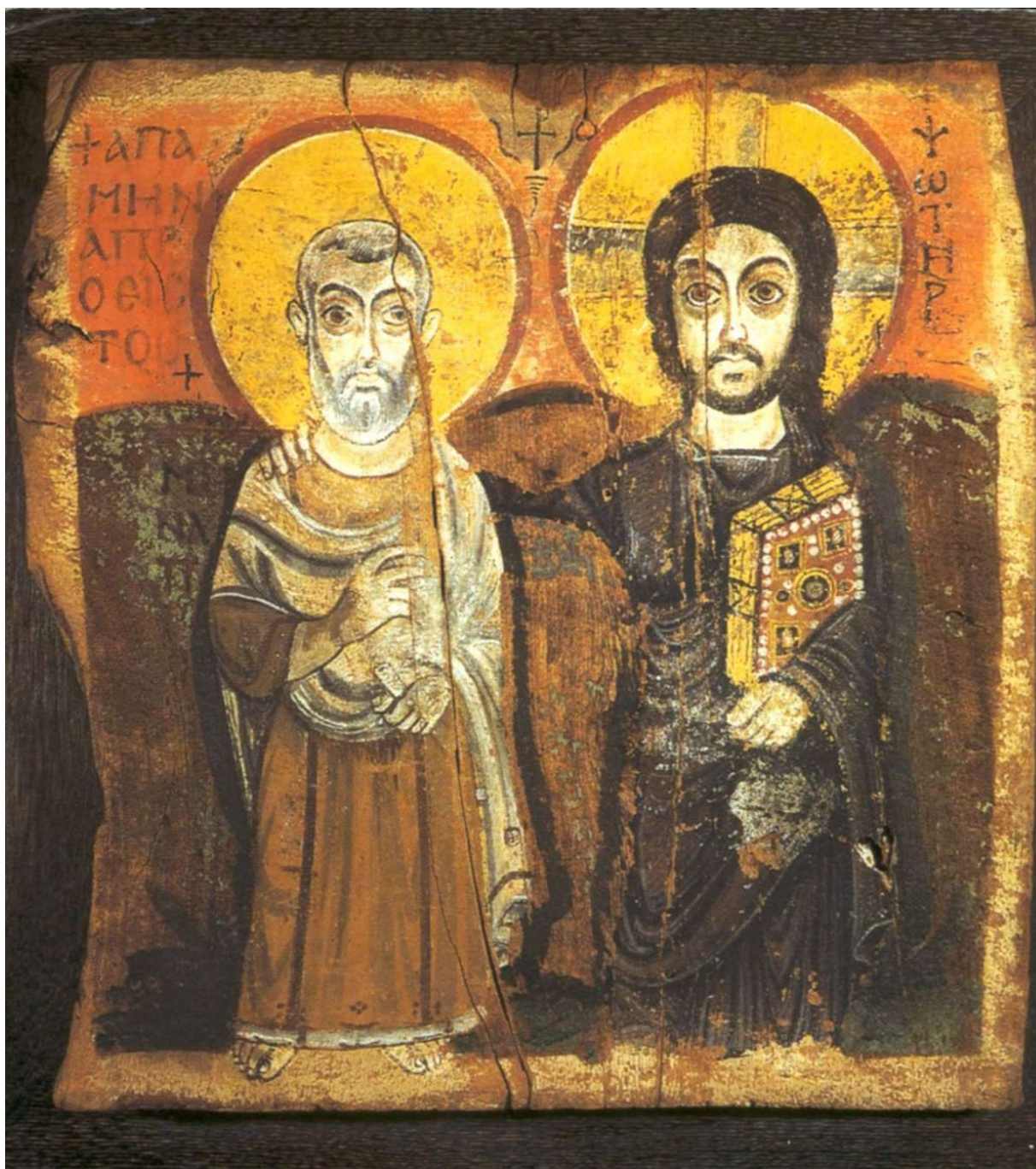
Jésus et son ami. Icône copte. 8 e siècle.